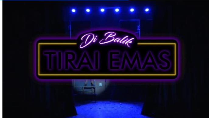
Gambar 7. Video Dokumenter Di Balik Tirai Emas

https://www.youtube.com/watch?v=o5OQLvbUwKQ