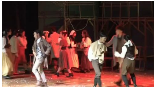
Gambar 1. Pertunjukan Kabaret Bandung

Kabaret Bandung adalah sebuah Seni pertunjukan modern berbentuk pertunjukan panggung yang dikemas secara menarik asal dari kota Bandung. jika di definisikan kesenian Kabaret Bandung adalah sebuah bentuk modernisasi dari sebuah pertunjukan panggung lainnya, jika di ibaratkan kesenian teater adalah sebuah kesenian tradisionalnya, maka kesenian Kabaret Bandung adalah bentuk kesenian kontemporernya (Istigfar, 2023). Pada dasarnya kesenian Kabaret bandung sama dengan seni pertunjukan lainnya dengan menampilkan pertunjukan yang menarik, menampilkan para aktor yang beradu peran, dihiasi musik latar yang megah, dan dihiasi dengan latar, properti, kostum serta make-up yang menarik, Namun Kesenian Kabaret Bandung tentulah memiliki ciri khas khusus yang membedakan kesenian ini dengan kesenian lainnya. Ciri khas utama dalam sebuah pertunjukan Kabaret Bandung adalah dengan menggunakan full audioplayback dalam pertunjukannya, yang artinya semua komponen audionya seperti musik latar, sound effect, dan dialognya tidak dilakukan secara live (Tumiwa, 2023).