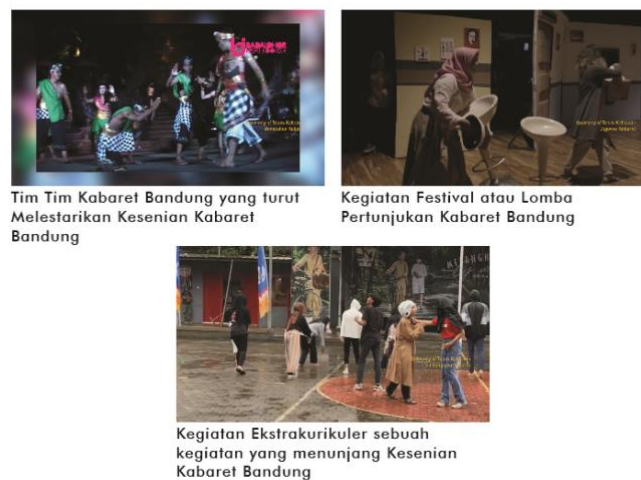
Gambar 4. Storyline Segment 2

Pada Segment 2 yang berjudul Perjalanan Kabaret Bandung, Akan menceritakan tentang Bagaimana Perkembangan Kabaret Bandung Hingga Ke Sebelum Masa Pandemi covid 19.