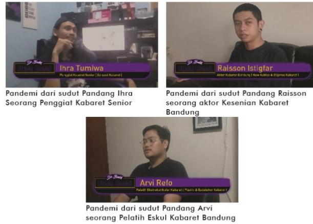
Gambar 5. Storyline Segment 3

Selanjutnya Segment 3 yang berjudul terhempas Pandemi. Pada Segment ini Akan diceritakan kondisi dari Kesenian Kabaret Bandung pada masa Pandemi Covid 19 dari 3 sudut pandang narasumber Penggiat Kabaret Bandung.