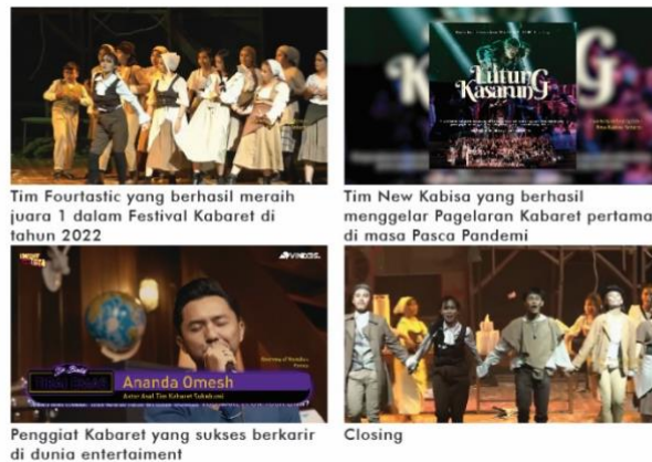
Gambar 6. Storyline Segment 4

Segment Terakhir pada Video dokumenter ini berjudul terlahir Kembali, di sini akan diceritakan kondisi Kabaret Bandung sekarang dan apa harapan mereka ke depannya.