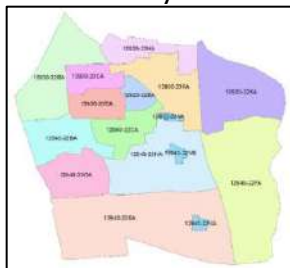
Gambar 8. Implementasi Sistem Kode Pos 5+NAA

Untuk RT yang tidak teridentifikasi diberi kode A, hasil implementasi pada wilayah DKI Jakarta untuk batas wilayah RW teridentifikasi penomorannya dilakukan pada wilayah Kecamatan Setiabudi pada area horizontal, bangunan tinggi, dan kawasan superblock yang tidak teridentifikasi batas wilayah RT ditunjukkan pada Gambar 8.