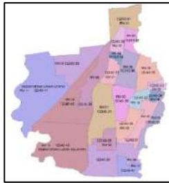
Gambar 5. Implementasi Sistem Kode Pos 5+NN

Sistem kode pos tujuh digit (5+NN) mencakup wilayah batas administrasi RW, bangunan tinggi (vertikal), kawasan superblock . Hasil implementasi ditunjukkan pada Gambar 3.5 dimana setiap wilayah RW pada suatu desa memiliki kode pos yang berbeda, namun duplikasi terjadi pada RW di desa yang berbeda tetapi memiliki kode pos eksisting yang sama dengan kelurahan/desa lain. Contoh duplikasi dapat dilihat pada Gambar 5.