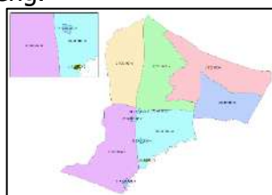
Gambar 9. Penerapan Sistem Kode Pos 9+A

Sistem kode pos 9+A merupakan kode pos berubah yang tidak terhubung dengan kode pos eksisting tetapi terhubung dengan kode wilayah. Hasil implementasi menunjukkan bahwa tiap wilayah kelurahan memiliki kode pos yang berbeda dan tidak memiliki duplikasi hal ini karena mengacu pada kode wilayah kemendagri yang mana setiap kelurahan memiliki kode yang unik. Gambar 9. menunjukkan implementasi sistem kode pos model 9+A pada Kecamatan Cengkareng.