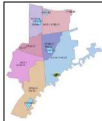
Gambar 6. Penerapan Sistem Kode Pos 5+NN Vertikal dan Superblock

Untuk penomoran pada area bangunan tinggi (V) yang pertama kali dibangun diberi angka 60 dan kawasan superblock diberi angka 80 (Kemenkominfo, 2021). Untuk saat ini duplikasi tidak terjadi karena penomoran yang di implementasikan pada rancangan sistem kode pos model ini masih dapat mengakomodir bangunan tinggi dan kawasan superblock . Hasil implementasi ditunjukkan pada Gambar 6.