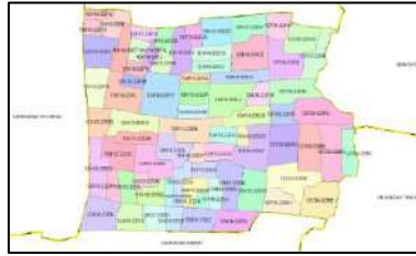
Gambar 7. Implementasi Sistem Kode Pos 5+NAA

Selatan tidak terdapat bangunan tinggi dan kawasan superblock . Gambar 7., menunjukkan bahwa setiap wilayah RT pada suatu desa memiliki kode pos yang berbeda, namun masih dimungkinkan terjadi duplikasi pada wilayah RT di kelurahan/desa yang berbeda jika kelurahan/desa tersebut memiliki kode pos eksisting yang sama.