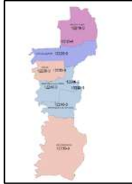
Gambar 4. Perapan Sistem Kode Pos 5+N Vertikal dan Superblock

Untuk penerapan model 5+N pada area bangunan tinggi (V) dan kawasan superblock (S) di DKI Jakarta menunjukkan bahwa memiliki kode pos sendiri yang berbeda dengan kode pos dari kelurahan/desa tempat bangunan tersebut berdiri. Contoh hasil implementasi sistem kode pos 5+N pada bangunan tinggi dapat dilihat pada Gambar 4.